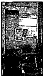
WhatsApp Image 2019-03-08 at 2.49.21 PM.jpeg 34K