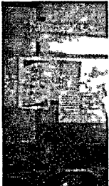
WhatsApp Image 2019-03-08 at 2.49.08 PM.jpeg 32K